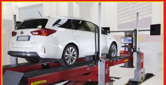
5 Possibilité de lecture avec pont élévateur soulevé aussi