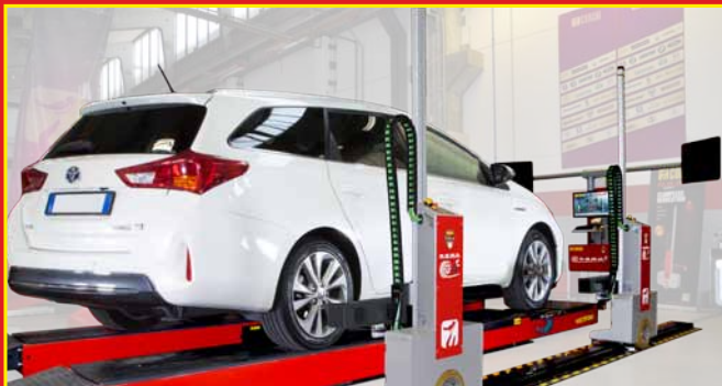
2 Recherche pont élévateur* - Recherche roue - Mesure roue