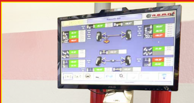
4 Résumé données contrôle de géométrie