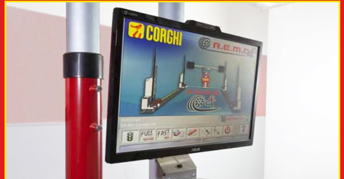
1 Sélection de la banque de données par l'opérateur

Fonction « Drive On Assistance » : pour aider le client à positionner son véhicule sur le pont élévateur