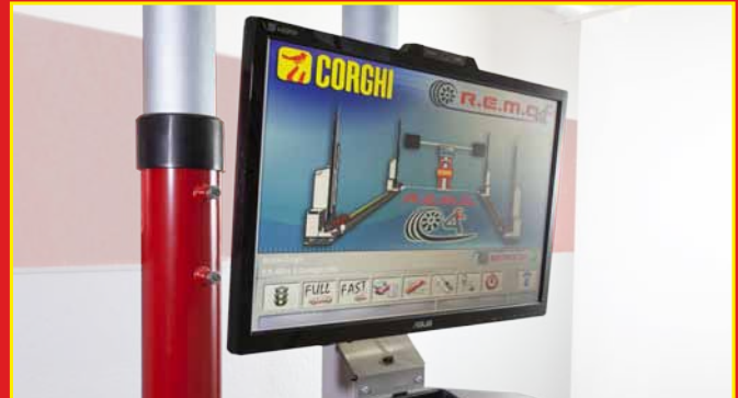
1 Der Bediener wählt die Datenbank

Funktion „ Drive On Assistance “: unterstützt den Kunden bei der Fahrzeugpositionierung auf der Hebebühne