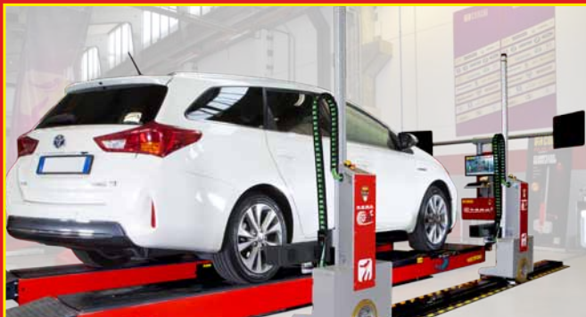
2 Achssuche* - Radsuche - Radvermessung