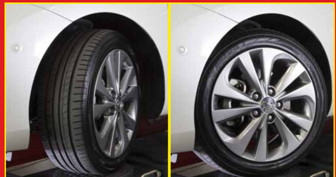
3 Messung der Parameter von Lenkeinschlag - Rad