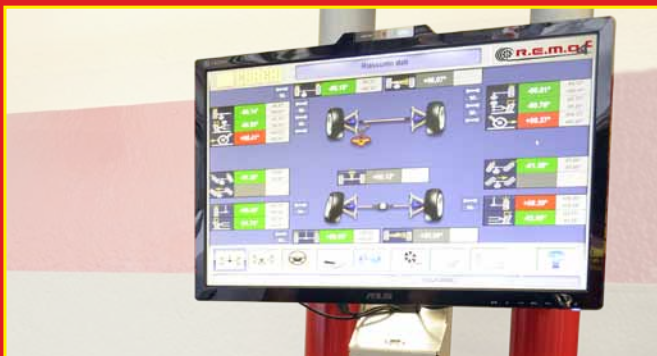
4 Zusammenfassung der Achsvermessungsdaten