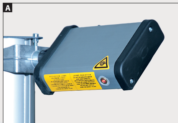
APONTADOR LASER para o alinhamento longitudinal.