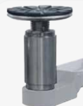
Set di estensioni tamponi 50 mm (4 pz) Set of lifting pad extensions 50 mm (4 pcs)